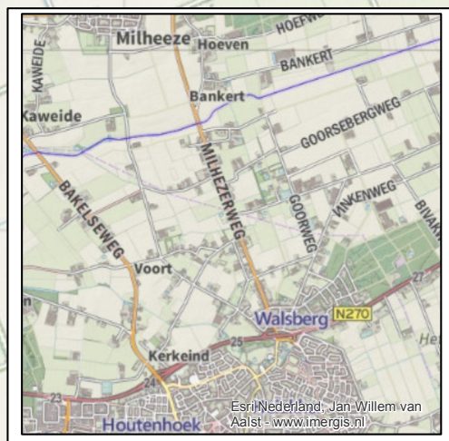
't Walsbergs ommetje 1:50.000